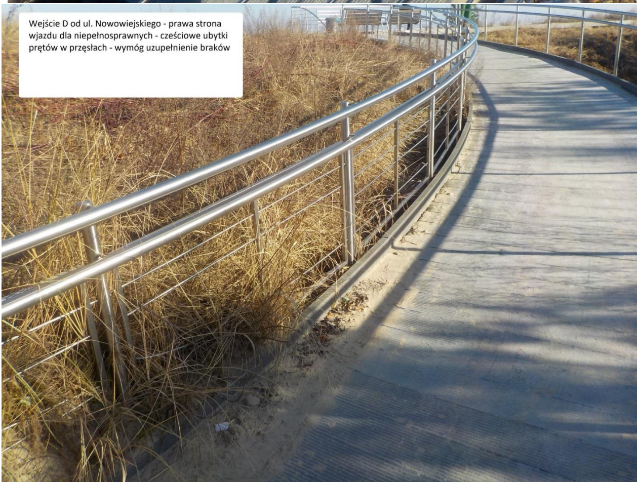
Wejście D od ul. Nowowiejskiego - prawa strona wjazdu dla niepełnosprawnych - częściowe ubytki prętów w przęsłach - wymóg uzupełnienie braków